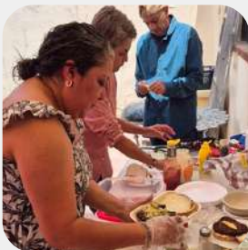
¡Preparando unas deliciosas hamburguesas!