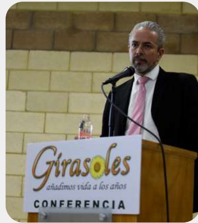
En la sexta Conferencia Comunitaria...

Hace 50 años llegó a Cd. Juárez. Comenzó a trabajar como ayudante de albañil durante 15 años, su buen desempeño le permitió llegar a ser maestro albañil, lo cual realizó por 35 años consecutivos. Desde hace 11 años trabaja como parquero en un tianguis de segundas. Girasoles reconoce su persistencia y entrega