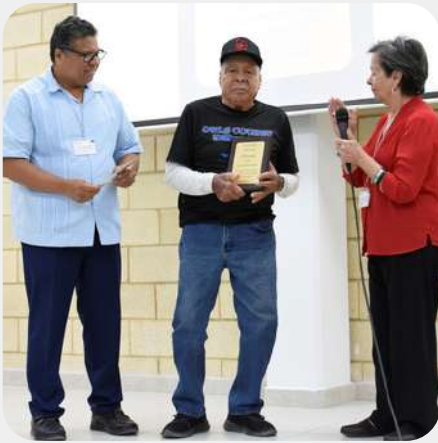
3er. Ganador del Premio "Adelante 2024"