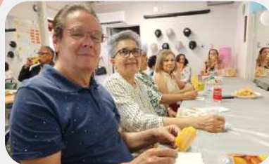
Disfrutando un postre muy refrescante. Gracias "Trevly" por el donativo de paletas.